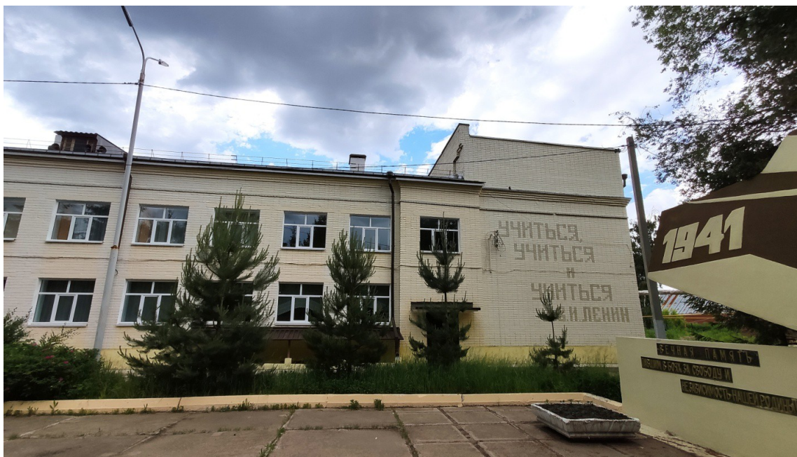
ШКОЛА № 17 г. КАЗАНИ 2021 год.

Говоря о наших любимых педагогах, вспоминаются строки прекрасного стихотворения А.С. Пушкина «19 октября».