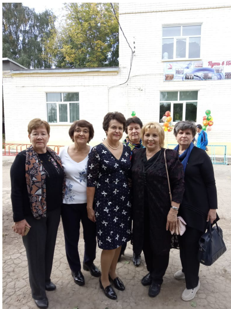
Встреча одноклассниц 10 А класса на юбилее школы № 17 в 2018 году. Мы поддерживаем теплые дружеские отношения и по настоящее время.